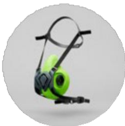
Media máscara BLS 4000 Next S