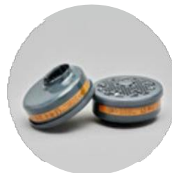
Filtros serie BLS 200