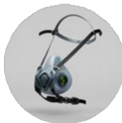
Media máscara BLS 4000 Next R