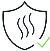
Protección ante gases