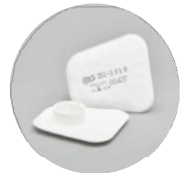
Filtros planos serie BLS 201