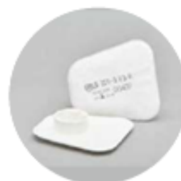
Filtros planos serie BLS 201