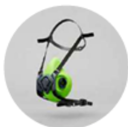
Media máscara BLS 4000 Next S