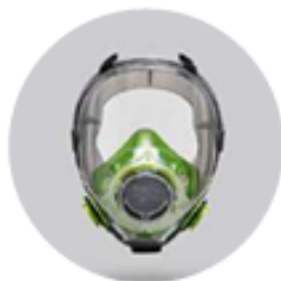
Máscaras BLS 5600