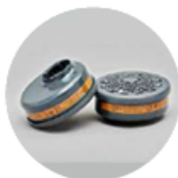
Filtros serie BLS 200