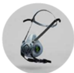
Media máscara BLS 4000 Next R