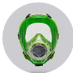
Máscaras BLS 5700